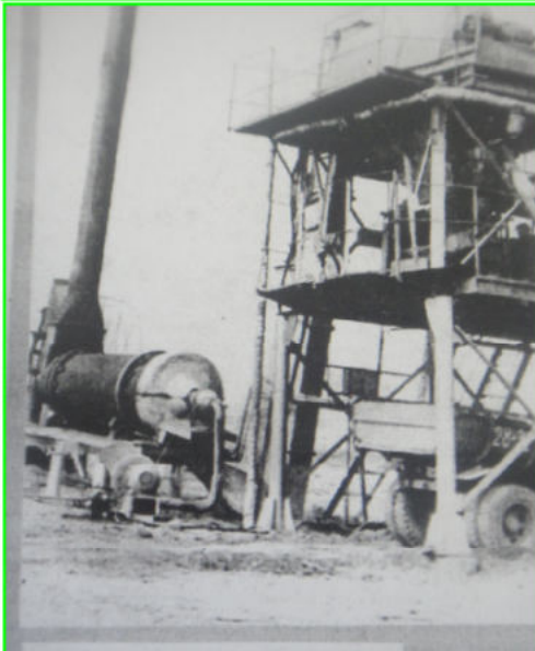
Куйтун. Асфальтовый завод.