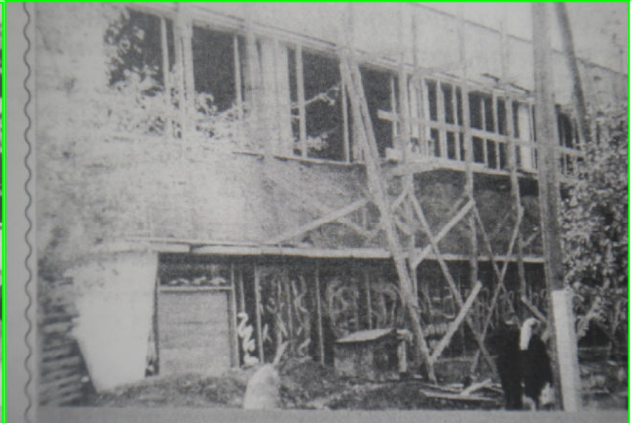
Куйтун, 1972 г. Строительство универсама.

Продолжение , начало в № 1 от 14.01.21 г.