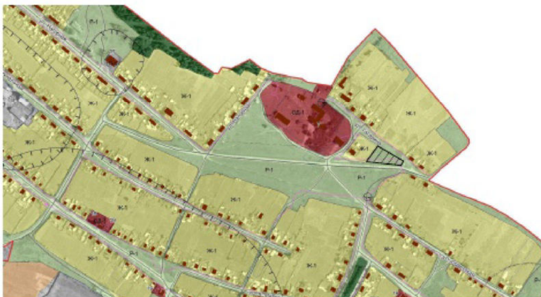
Схема расположения территориальной зоны Р-1 «Зона природного ландшафта» для включения ее в границы территориальной зоны Ж-1 «Зона застройки индивидуальными жилыми домами», в целях размещения объектов жилой застройки